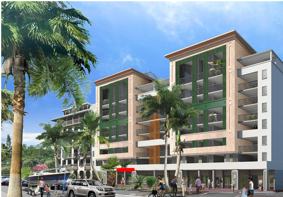
PERSPECTIVE (non contractuelle)