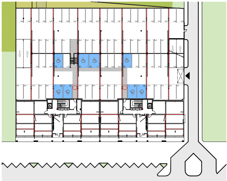
PLAN DE MASSE - PARKING RDC