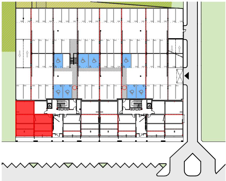
PLAN DE MASSE - PARKING RDC